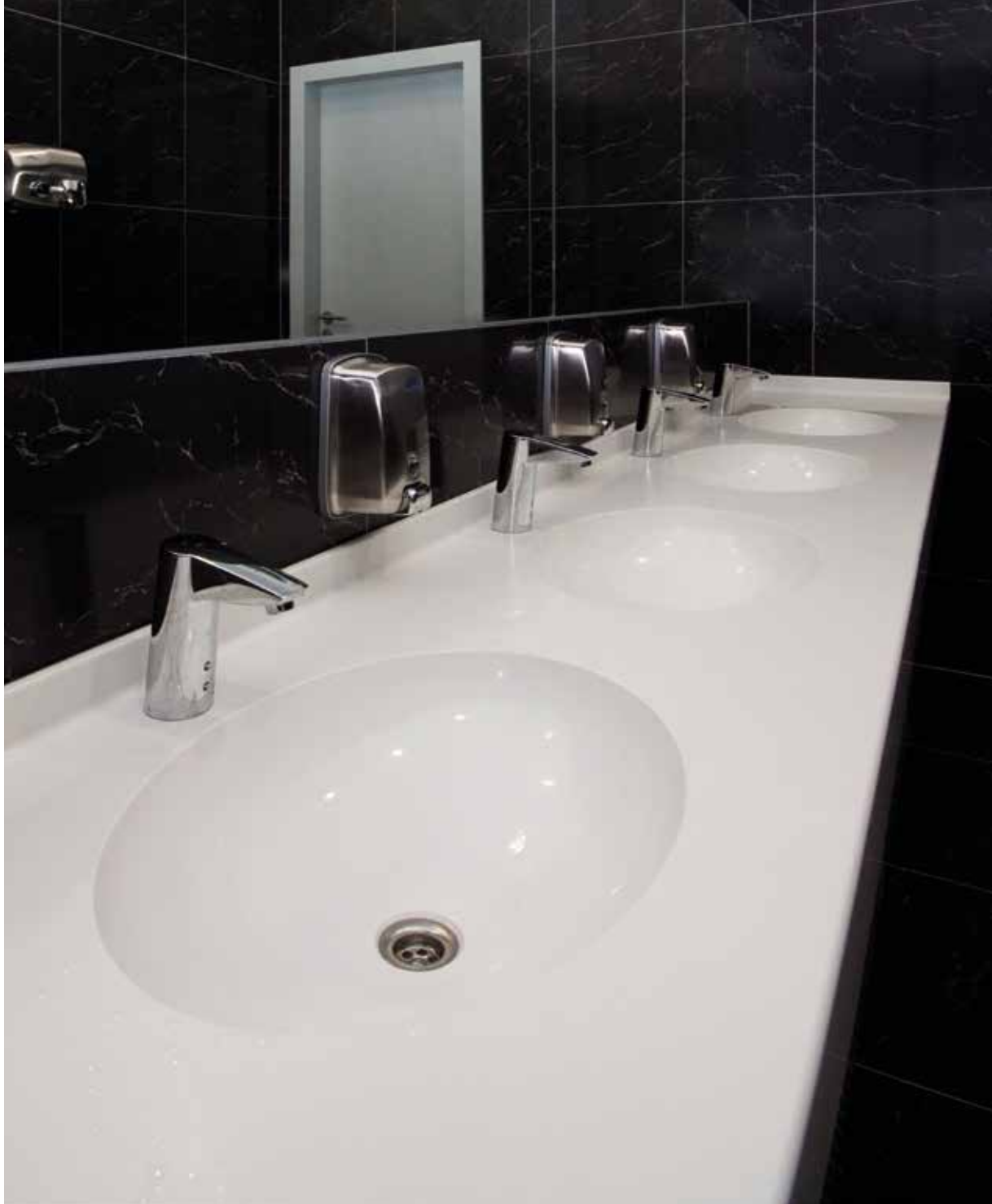
Detail umyvadlové desky s integrovanými umyvadly