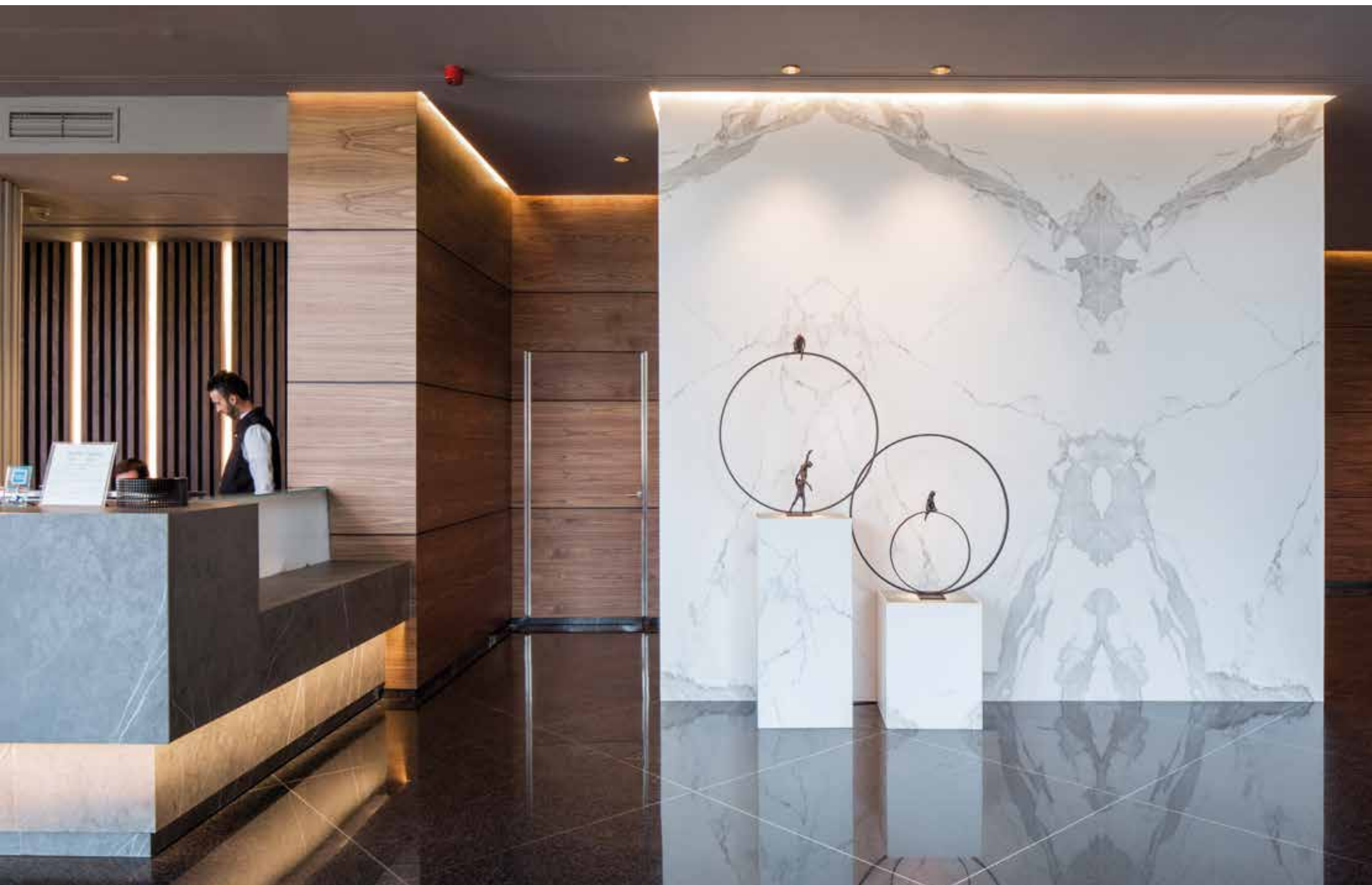
Obklad recepčního pultu a stěny v hotelovém foyer z velkoformátové keramiky