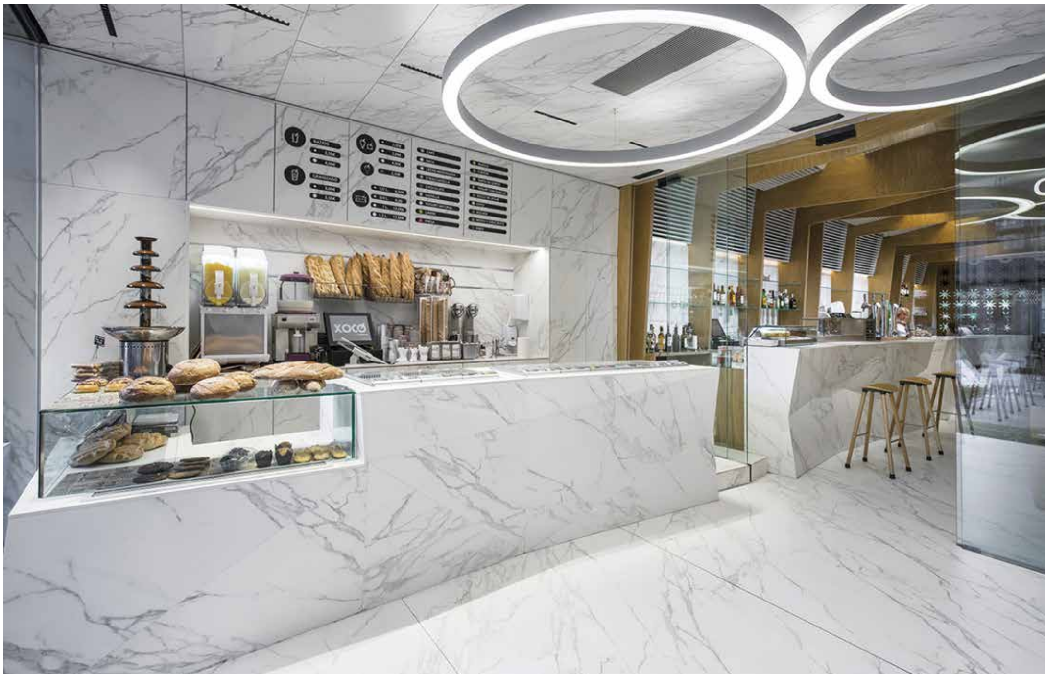
Prodejní prostory s velkoformátovým obkladem a dlažbou na míru z keramiky Porcela, vzor Callacata | Kafetérie XOCÓ, Španělsko