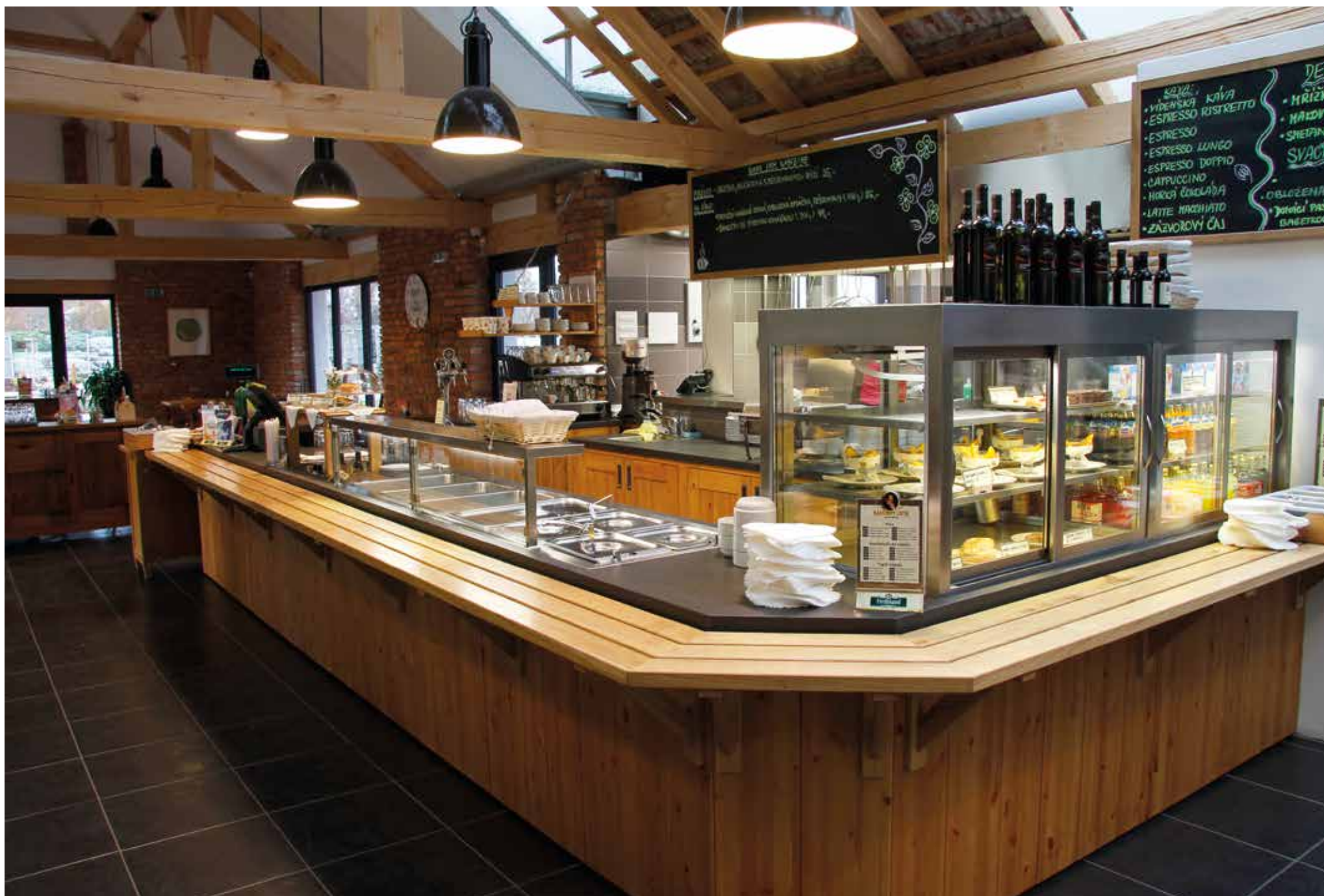
Restaurační pult s pracovní deskou z keramiky Porcela, vzor Basalt Black | Restaurace Zahradní centrum, Jindřichův Hradec