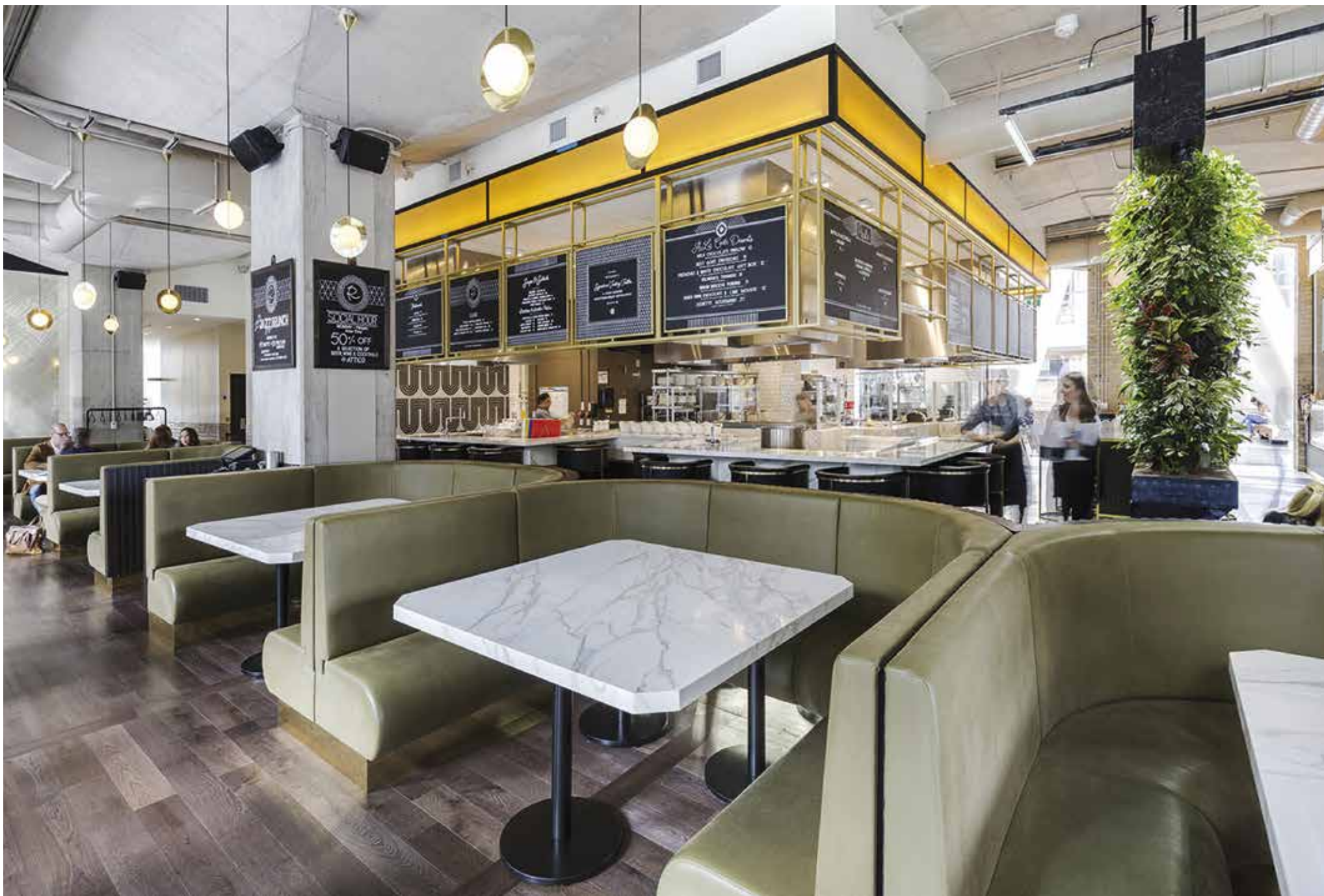
Pracovní desky, kavárenské stoly a obklad baru z keramiky Porcela, vzor Callacatta | Ricardas restaurant, Toronto