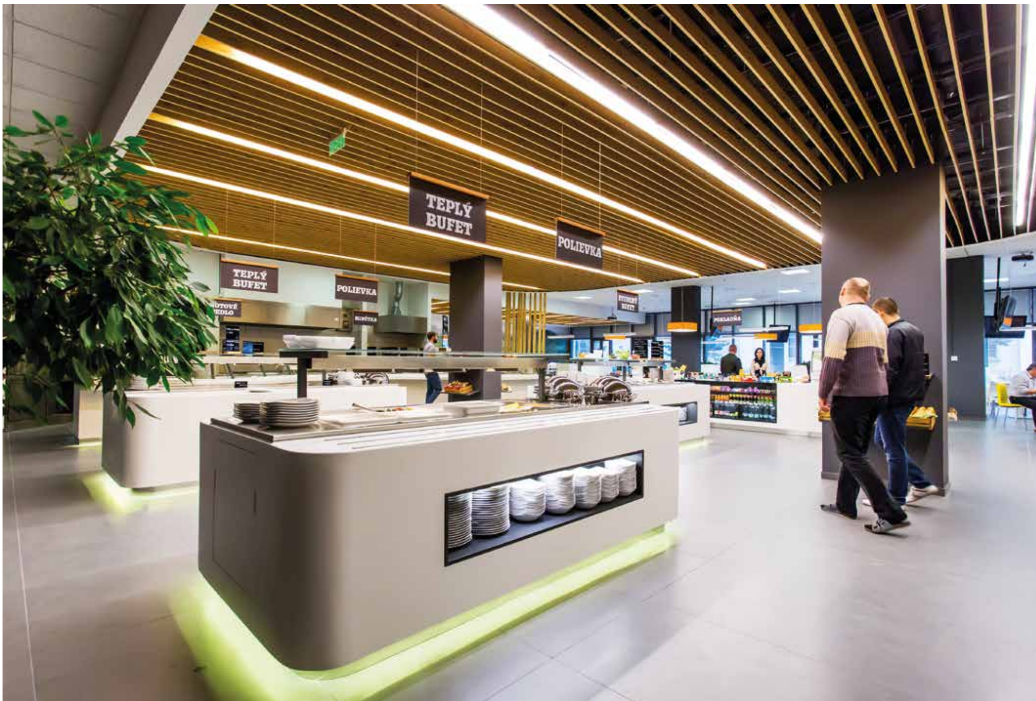
Gastro pulty, samoobslužné ostrovy z Polyston Solid Surface, vzor Ultra White. Dlažba keramika Porcela, vzor Barro | Restaurace Eurest, DELL Bratislava